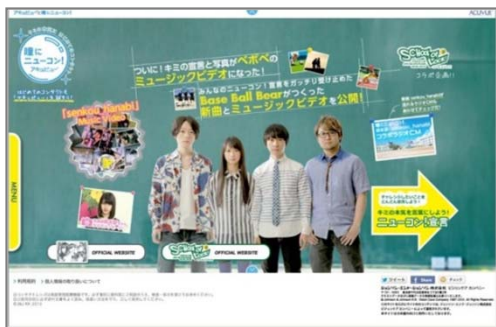
BBBのニューコンソング

「senkou_hanabi」は、10代のミュージシャンだけが参加できる音楽の甲子園「閃光ライオット2013」の公式応援ソングとなり、完成されたミュージックビデオは、8月4日(日)に日比谷野外音楽堂で開催された「閃光ライオット2013」ファイナルで初上映されました。8月5日(月)より、本サイトでも公開中です。