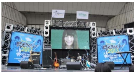
「閃光ライオット」ファイナルの様子