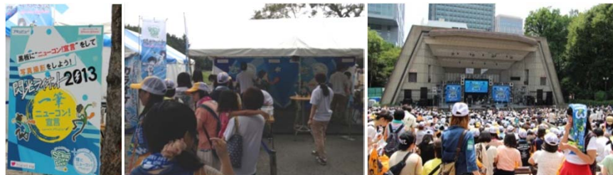
「アキュビュー」ブースには、黒板が登場。 当日もたくさんの“ニューコン！宣言”が集まりました。