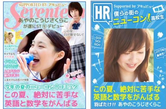
Seventeen、HR 風のオリジナル表紙