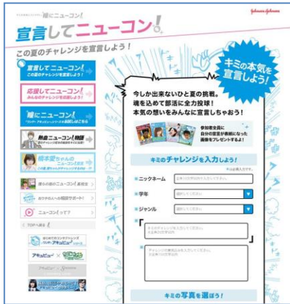
『宣言してニューコン!』画面

また、『応援してニューコン！』では、投稿された「ニューコン宣言」の中から、共感したものに“ニューコンボタン”を押して応援することができます。