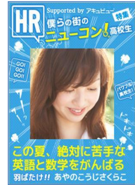
Seventeen、HR 風のオリジナル表紙