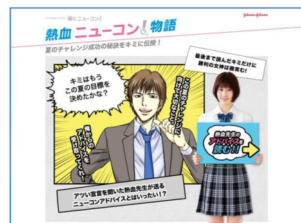
『熱血ニューコン! 物語』画面

チャレンジしたい、がんばりたいことのためにコンタクトレンズデビューを考えはじめることも多い中高生に向けて、コンタクトレンズの基礎知識などについて紹介するデジタルコミック。初めてのコンタクトレンズで分からないことや不安なこと、気をつけたいことなどを、コミック形式で楽しみながら学び、解消するサポートをいたします。