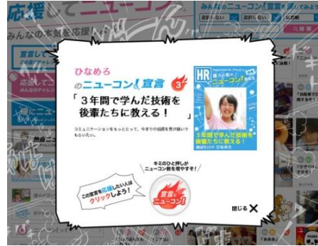
『応援してニューコン』画面