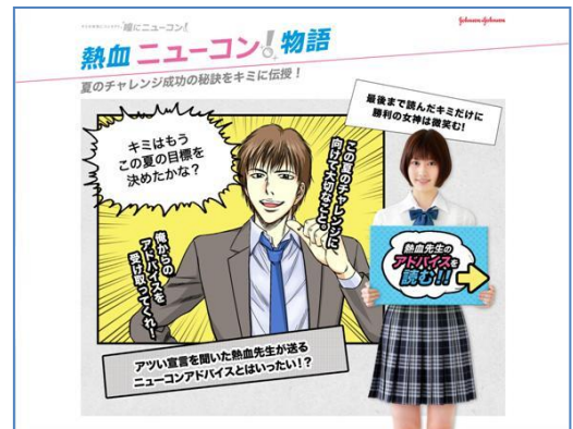
熱血ニューコン！物語画面

初めてのコンタクトレンズで分からないことや不安なこと、気をつけたいことなどを、コミック形式で楽しみながら学び、解消するサポートをいたします。『熱血ニューコン！物語』を最後まで読むと、『宣言してニューコン』で生成された、「Seventeen」、「HR」などの雑誌オリジナル表紙がもらえ、携帯の待ち受けにして保存できます。