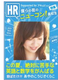
Seventeen、HR 風のオリジナル表紙