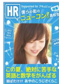
Seventeen、HR 風のオリジナル表紙