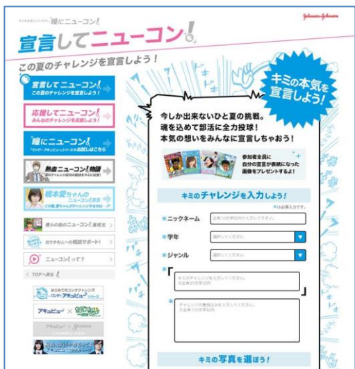
『宣言してニューコン』画面

「ニューコン宣言」と一緒に画像を投稿すると、雑誌「Seventeen」や「HR」の表紙デザインに、宣言と画像がデザインされ、人気雑誌の表紙に自分が登場したようなオリジナル画像ができあがります。表紙風の画像は、ソーシャルメディア (Facebook/Twitter/mixi) を通じて友達に知らせたり、プロフィールアイコンのサイズに合わせてダウンロードすることができます。また、『応援してニューコン！』では、投稿された「ニューコン宣言」の中から、共感したものに“ニューコンボタン”を押して応援することができます。検索機能もあり、同じ部活の人の宣言を見ることが可能です。