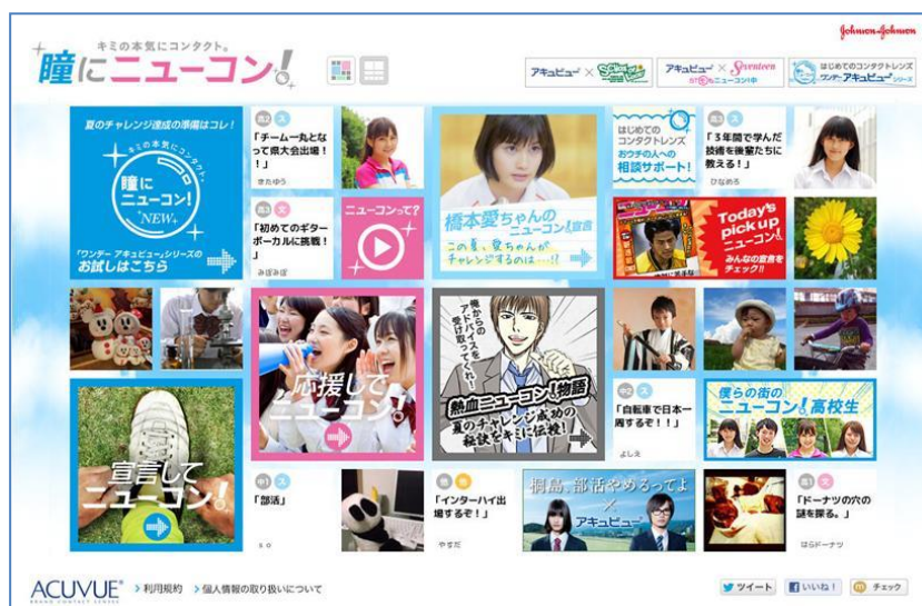
「キミの本気をはじめよう。瞳にニューコン！」ウェブサイト TOP 画面

コンタクトレンズを使い始める時期について聞いた調査では、中学、高校で9割という結果が出ており、そのきっかけを“スポーツ”と答えています。実際に、彼らの8割以上が何かしらの部活動に参加していることも分かっています*1。「アキュビュー」は、そんな中高生の(NEW)コンタクトレンズでチャレンジする姿をサポートします。