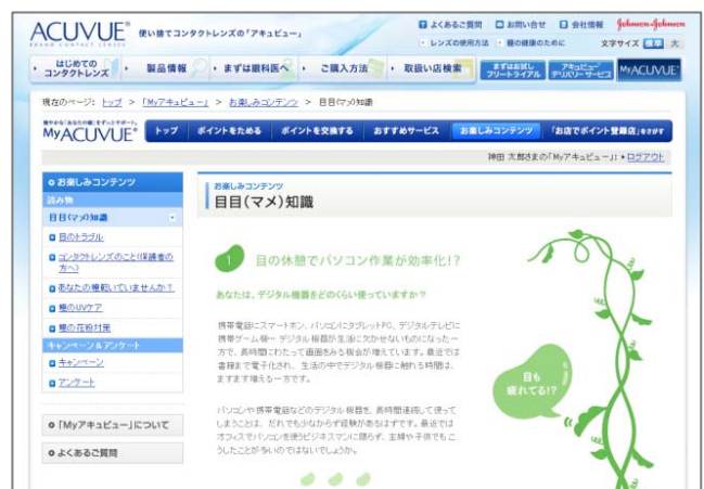
『目目(マメ)知識』ページ画面イメージ