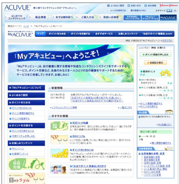
『My ページ』画面イメージ